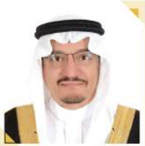
معالي وزير التعليم