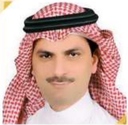
رئيس جامعة الجوف