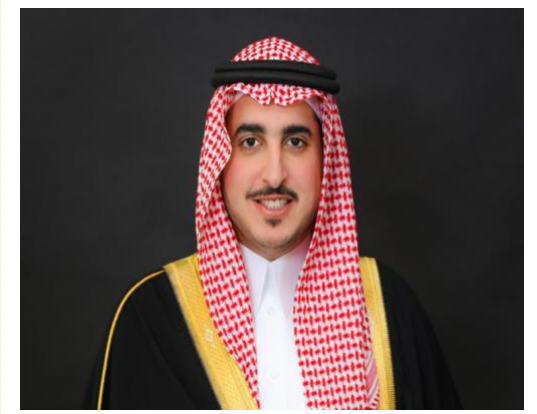
الأمير فيصل بن نواف بن عبد العزيز آل سعود أمير منطقة الجوف