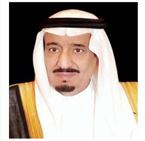
الملك سلمان بن عبد العزيز آل سعود خادم الحرمين الشريفين