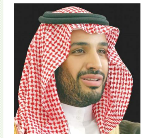
الأمير محمد بن سلمان بن عبد العزيز آل سعود ولي العهد